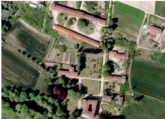
Foto aerea del complesso delle cascine all'interno della tenuta del castello di Sansalvà. Le cascine, terminate ad inizio '800, sono state completamente ristrutturate, nel rispetto delle strutture rurali originarie.

cascine pallavicini DOVE VIVERE. MEGLIO.