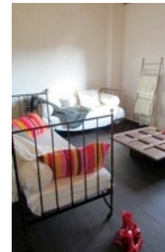
L'eccellente coibentazione di tetti e pareti, il recupero delle acque piovane dalle falde, l'utilizzo del sole per illuminare con camini di luce e produrre calore ed energia con pannelli solari e fotovoltaici rendono le cascine un progetto pilota a livello europeo e una scelta felice per chi sogna una maggiore sostenibilità economica ed ambientale.

Ogni appartamento rivela nicchie, caminetti, pietre, legni, cotto, volte, finestre sul cielo.